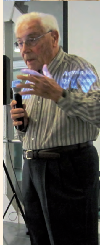
Fotografías: A. Aura